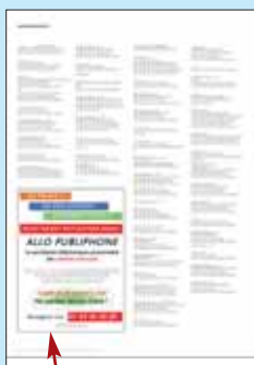
9 x 12 cm 1/4 page en hauteur