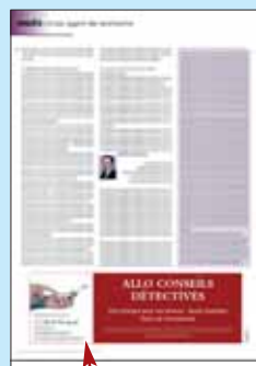
18 x 6 cm 1/4 page bandeau