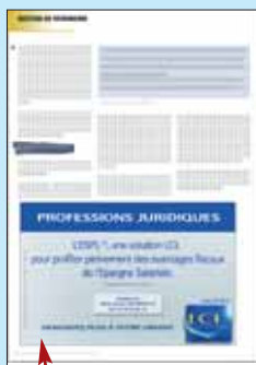
18 x 12 cm 1/2 page bandeau