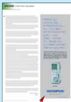
9 x 25 cm 1/2 page en hauteur